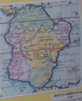
KAPA DA AMERICA NOVA - 1520 Mapa de autoria de Diego Velazquez, baseado nos dados de Colombo e Vesputi. Original na Biblioteca Nacional de França-Paris.