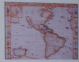
MAPA DA AMÉRICA DO SUL - 1620 Mapa de autoria de Frederico Bassano. O Brasil que o Brasil possui nos seus limites de fronteira, pelas das Américas e Países.