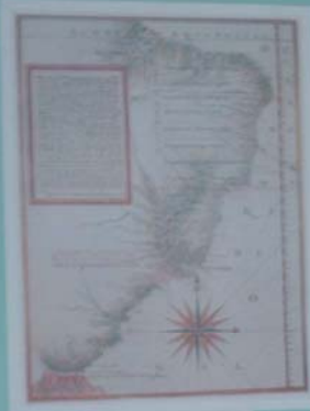
MAPA DE LOS TEXEIRA - 1774 Mapa de 7 latitudes longitudinais, com o eixo perpendicular para Chile, de Lisboa de Tomé de Sousa, Original na Biblioteca de Lisboa, Portugal.