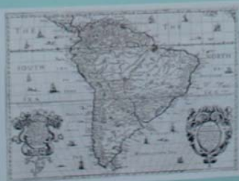
MAPA DA AMÉRICA DO SUL - 1870 Mapa de autoria de Richard Hallé. Este mapa mostra o Brasil nos seus limites de fronteira, pelas das Américas e Países.