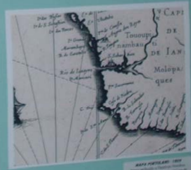
MAPA PARAÍBARI - 1804 Mapa elaborado e gravado por Pires, Original na Biblioteca de Lisboa, Portugal. O mapa de Pires foi o primeiro a mostrar o rio Paraíba com o nome atual, e também a mostrar a cidade de João Pessoa, que ainda não tinha sido fundada.