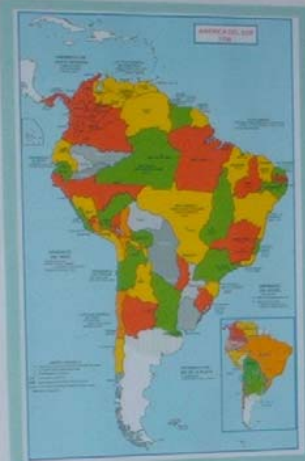
MAPA DA AMÉRICA DO SUL - 1827 O mapa mostra a divisão política da época, para a América do Sul e Brasil. Observe que parte do Rio Grande do Sul, Santa Catarina e Paraná estavam sob jurisdição portuguesa.