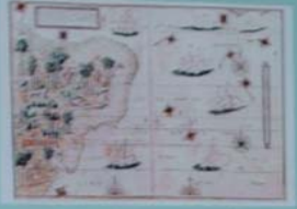
KAPA DO BRASIL - 1574 Mapa de autoria de Daniel Heinsius, baseado nos dados de Colombo e Vesputi. Original na Biblioteca Nacional de França-Paris.