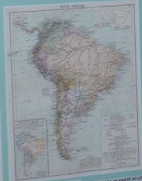
MAPA DA AMÉRICA DO SUL DO BRASIL - 1827 Este mapa mostra novamente a divisão em 1763 e inclui os dados de fronteira do vale do Paraíba. Este mapa foi elaborado por volta de 1760.