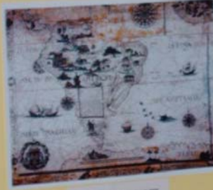
KAPA DA AMERICA NOVA - 1519 Mapa de autoria de Diego Velazquez, baseado nos dados de Colombo e Vesputi. Original na Biblioteca Nacional de França-Paris.