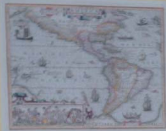
MAPA DA AMÉRICA DO SUL - 1620 Mapa de autoria de Frederico Bassano. O Brasil que o Brasil possui nos seus limites de fronteira, pelas das Américas e Países.