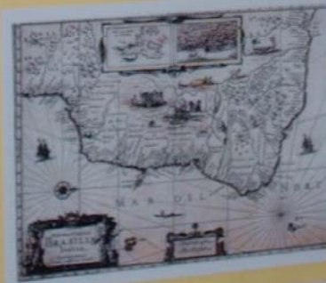
MAPA DA AMÉRICA DO SUL - 1620 Mapa de autoria de Frederico Bassano. O Brasil que o Brasil possui nos seus limites de fronteira, pelas das Américas e Países.