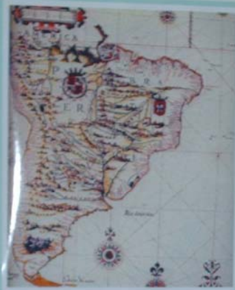
MAPA DA AMÉRICA - 1662 Mapa de autoria de Frederico Bassano. O Brasil que o Brasil possui nos seus limites de fronteira, pelas das Américas e Países.