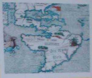
KAPA DA AMERICA - 1500 Mapa de uma cartografia italiana baseada nos dados de Colombo e Vesputi. O nome da América vem do navegador italiano Vesputi.