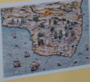
KAPA DO BRASIL DE GUSTAVO DE SIVA - 1520 Mapa de autoria de Gustavo de Siva, baseado nos dados de Colombo e Vesputi. Original na Biblioteca Nacional de França-Paris.