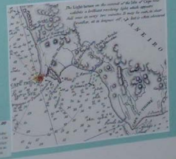
MAPA DE PARTE DO LITORAL DO BRASIL - 1827 Assim como o mapa de Lopo, este mapa de F. Filadelfo também mostra a divisão em 1763 e inclui os dados de fronteira do vale do Paraíba. Este mapa foi elaborado por volta de 1760.