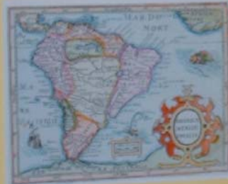
MAPA DA AMÉRICA DO SUL - 1620 Mapa de autoria de Frederico Bassano. O Brasil que o Brasil possui nos seus limites de fronteira, pelas das Américas e Países.