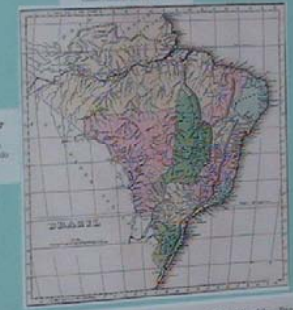
MAPA DO BRASIL - 1827 Mapa de autoria de F. Filadelfo. Observe que neste mapa o Rio de São Paulo pertence ao Brasil.