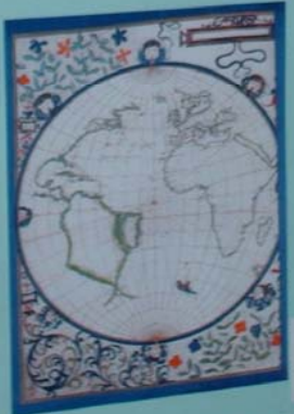
KAPA MUNDO - 1590 Mapa do mundo de autoria de Willem Blaeuw, baseado nos dados de Colombo e Vesputi. Original na Biblioteca Nacional de França-Paris.