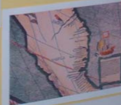
MAPA DO MUNDO 1569 Primeiro mapa publicado em Portugal, mostrando a América descoberta por Cristóvão Colombo