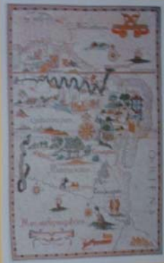
KAPA DO BRASIL - 1511 Mapa de autoria de Diego Velazquez, baseado nos dados de Colombo e Vesputi. Original na Biblioteca Nacional de França-Paris.