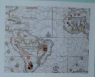
CARTE ATLANTICA E DO PACIFICO ORIENTAL 1667 Mapa de João Teixeira Albernaz. O Brasil que o Brasil possui nos seus limites de fronteira, pelas das Américas e Países.