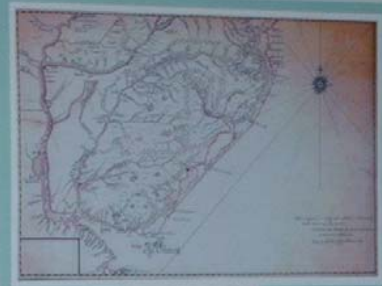
MAPA DO BRASIL - 1827 Observe os limites do Rio de São Paulo. Este mapa foi o primeiro a mostrar o rio Paraíba com o nome atual, e também a mostrar a cidade de João Pessoa, que ainda não tinha sido fundada.