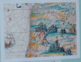
ATLAS MUNDI - 1588 Mapa do mundo de autoria de Willem Blaeuw, baseado nos dados de Colombo e Vesputi. Original na Biblioteca Nacional de França-Paris.