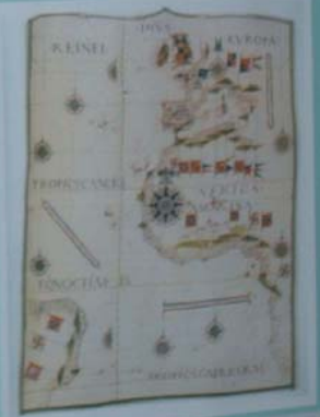
KAPA DE JAVES REVEL - 1595 Mapa de Javes Revele, baseado nos dados de Colombo e Vesputi. Original na Biblioteca Nacional de França-Paris.