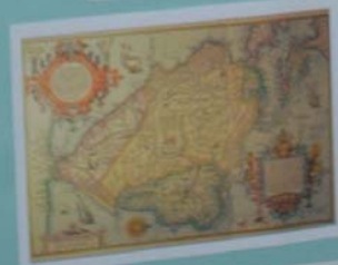
MAPA DA AMÉRICA DO SUL - 1799 Mapa elaborado por Pires e gravado por Pires, Original na Biblioteca de Lisboa, Portugal. O mapa de Pires foi o primeiro a mostrar o rio Paraíba com o nome atual, e também a mostrar a cidade de João Pessoa, que ainda não tinha sido fundada.