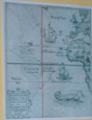
Mapa de 1594 segundo a Tabela de Demarcação entre os territórios de Portugal e Castela pelo TRATADO DE TORDÉSILLAS (17 de junho de 1494)

Os mitos e conceitos também estiveram presentes, influenciando a Cartografia. O ponto central de alguns mapas antigos era ocupado por uma representação sagrada, uma sacralidade (p.ex.: monte Sion dos hebreus, monte Maru dos hindus) ou por cidades (p.ex.: Jerusalém dos cristãos, Meca dos muçulmanos). Há em um mapa cristão do século XV, uma alegoria bíblica que mostra cada continente, sul, sendo coberto, (Ásia, Europa e África) como pertencentes aos filhos de Noé (a Ásia pertence a Sem; a África a Cam e a Europa a Jafé).