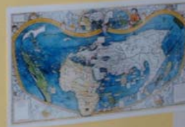
MAPA MUNDO - 1507 Primeiro mapa publicado em Portugal, mostrando a América descoberta por Cristóvão Colombo