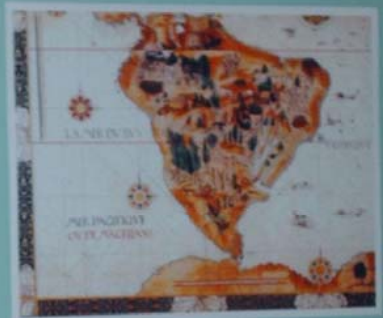
MAPA DE AMÉRICA DO SUL - 1798 Planois e mapas de Serna y Torres em homenagem à sua mãe, São Paulo e do Rio de Janeiro.