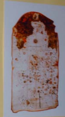
MAPA DO MUNDO - 1500 Carta do Rei de Castela, príncipe da Espanha, Cristóvão Colombo e Américo Vesputi (1492, 1493)