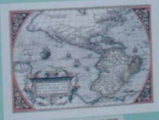
MAPA DA AMÉRICA DO NORDE - 1788 Mapa elaborado e gravado por Christian Morano e Daniel Morano de acordo com o Tratado de Madrid, que trata sobre o comércio internacional do Brasil.