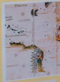
MAPA DAS ÁRTICAS DO REINO 1595 Primeiro de Charles Wilkes, cartógrafo da USN, filho de Charles, Criador da Biblioteca Congress, Vaticano