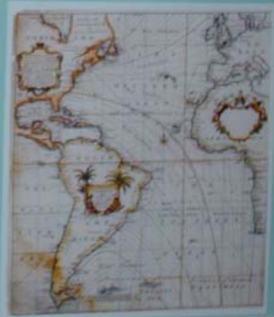
MAPA DA AMÉRICA DO SUL - 1870 Mapa de autoria de Richard Hallé. Este mapa mostra o Brasil nos seus limites de fronteira, pelas das Américas e Países.